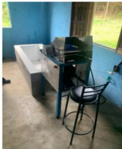
Figura 03 - Máquina de Ralar e reforma do reservatório suporte

cortes manuais prévios. O novo bico de saída e as laterais reforçadas minimizaram o desperdício de massa ralada, aumentando o rendimento e a produtividade.