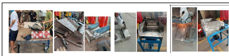
Figura 2 – Processos de fabricação mecânica e metalúrgica da Máquina de Ralar

Com base nessas constatações, foi realizada um redimensionamento do projeto da máquina com manutenção corretiva que envolveu a ampliação do bico de saída com soldagem de chapas de aço, de forma análoga o aumento das áreas laterais do compartimento de ralagem de mandioca e o alargamento da entrada de alimentação da máquina.