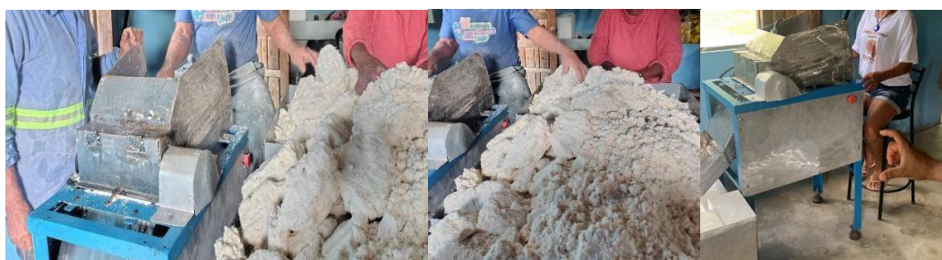
Figura 4 – Mosaico de imagens: Utilização da Máquina pela Comunidade

a comunidade passasse a atender novas demandas, inclusive externas, impulsionando sua participação em feiras de economia solidária da região metropolitana de Salvador e desenvolvesse as próprias feiras de economia solidária. Nesses espaços, a farinha produzida no Dandá é reconhecida não apenas por sua qualidade, mas também por representar a resistência, a organização coletiva e os modos de vida quilombolas da Bahia. Assim, o projeto fortaleceu as estratégias de soberania alimentar, geração de renda e valorização sociocultural da comunidade, objetivos do desenvolvimento sustentável global (ONU, 2015).